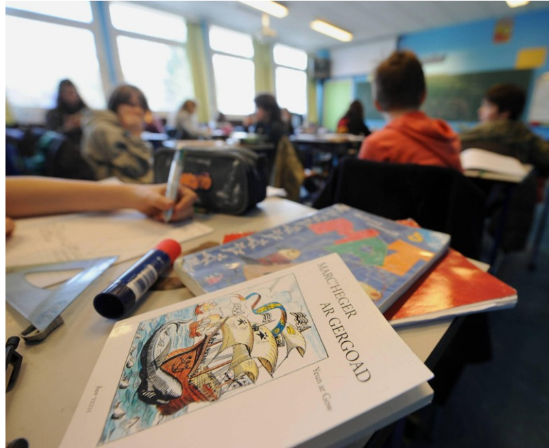
Dans une classe de 5 ème du collège Diwan de Quimper