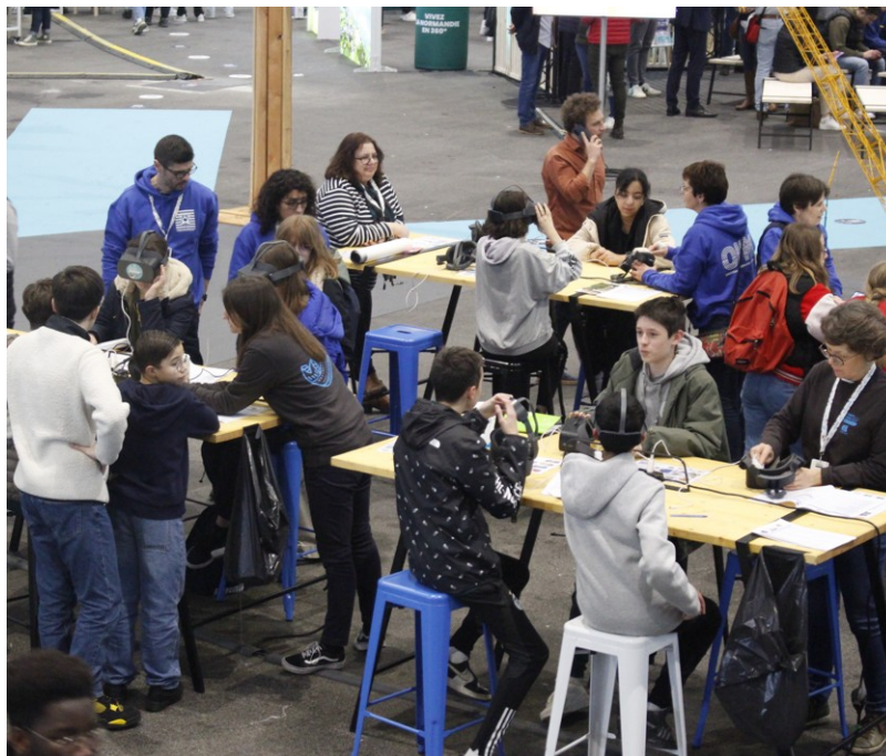
Lors du Salon régional de l'orientation et des métiers 2024 à Caen.