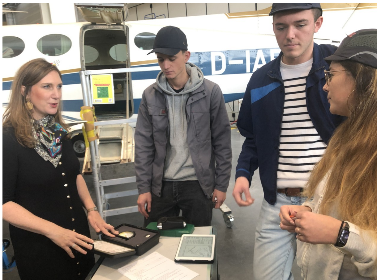
En décembre dernier, Carole Grandjean (ici à gauche), alors ministre déléguée chargée de l'Enseignement et de la Formation professionnelle, avait rencontré des élèves de BTS spécialisés en aéronautique, en formation au Campus de la cité saint-nazaire, à Saint-Nazaire.

Globalement, la réforme vise à faire du lycée professionnel un choix d'avenir. Pour cela, les offres de formation pro se sont progressivement transformées. « Il s'agit d'ouvrir des formations qui correspondent aux métiers d'avenir. Les sec-