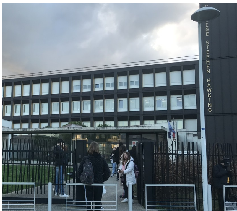
Au cours de la 3 e , les élèves vont faire leurs vœux d'affectation dans un lycée. Théoriquement, chacun doit intégrer l'établissement le plus proche de son domicile.