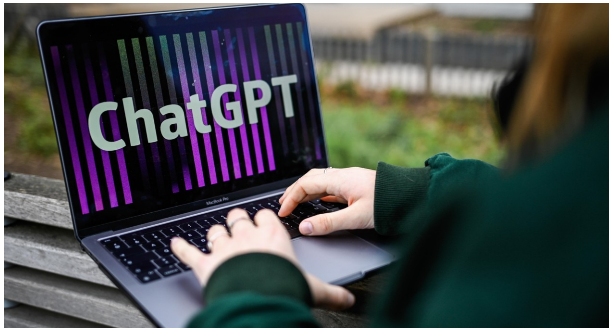
ChatGPT est la plus connue des applications conversationnelles utilisant l'intelligence artificielle. Elle a été conçue et lancée en novembre 2022 par la société américaine OpenAI.