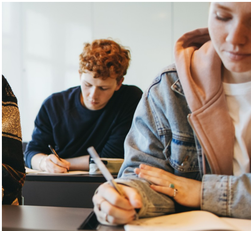
À l'épreuve de philosophie du bac, les candidats ont le choix entre trois types de sujets : deux dissertations et une explication de texte.