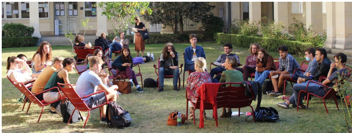
La cour du campus Sciences Po à Rennes.

Par ailleurs, le concours d'entrée en 1 ère année de Sciences Po est organisé conjointement par les sept écoles du réseau (Aix, Lille, Lyon, Rennes, Strasbourg, Saint-Germain-en-Laye et Toulouse). Il permet donc de candidater en même temps à toutes. Un nombre total de 1 100 places a été proposé en 2023. Pour cette session 2024, les trois épreuves écrites sont pré-