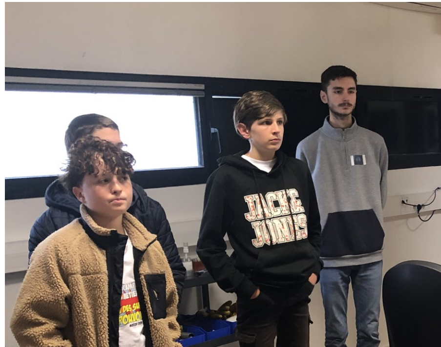
Le stage de 3 e est devenu un des moments forts de la scolarité au collège. Ici, des élèves de catation de fibres optiques.

Outre le savoir-être (respect des horaires, des consignes, du groupe), les qualités requises chez le stagiaire sont avant tout l'écoute et la curiosité. Ce dernier aura un rapport de stage à rédiger, qui peut faire l'objet d'un échange avec son tuteur dans