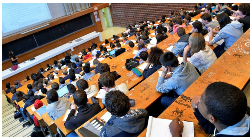
Les modalités des épreuves sont généralement publiées sur le site des écoles, ainsi que le thème général des épreuves.

Les journées portes-ouvertes des écoles et des universités généralement organisées en début d'année civile après l'ouverture de Parcoursup permettent de connaître les dates des épreuves, les attendus, les modalités de concours. Par exemple, lors de ses portes-ouvertes, l'EESAB (Ecole européenne supérieure d'art de Bretagne) a présenté outre l'école et ses enseignements, les épreuves et le déroulé complet de la procédure d'admission dans ses quatre sites (Quimper, Rennes, Brest, Lorient). Il est important d'anticiper ces épreuves d'admission et de tenir compte du calendrier, sachant que chaque lycéen formule une dizaine de vœux sur Parcoursup... Attention à bien