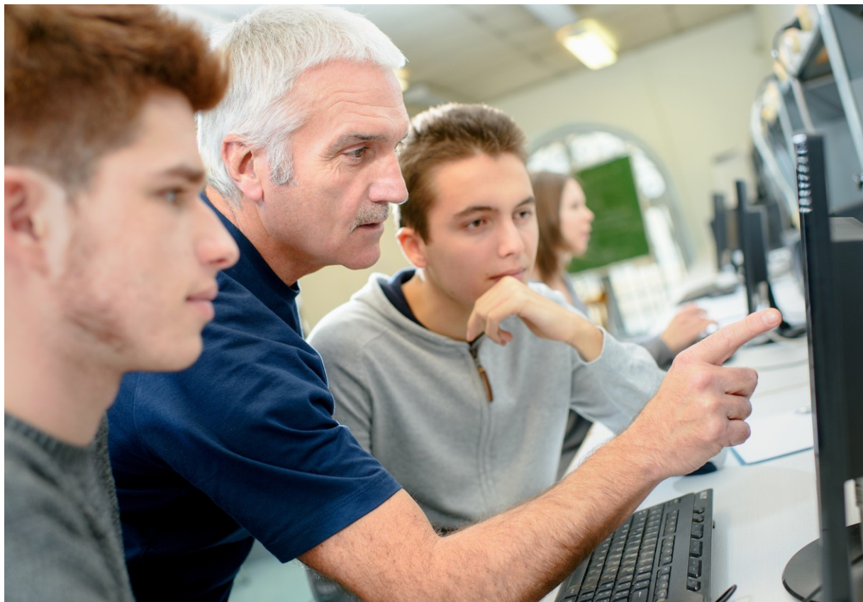
En IUT informatique, il y a autant de places réservées aux deux types de bacheliers.

En théorie. Mais les chiffres diffèrent selon les filières... On peut consulter sur Parcoursup les chiffres