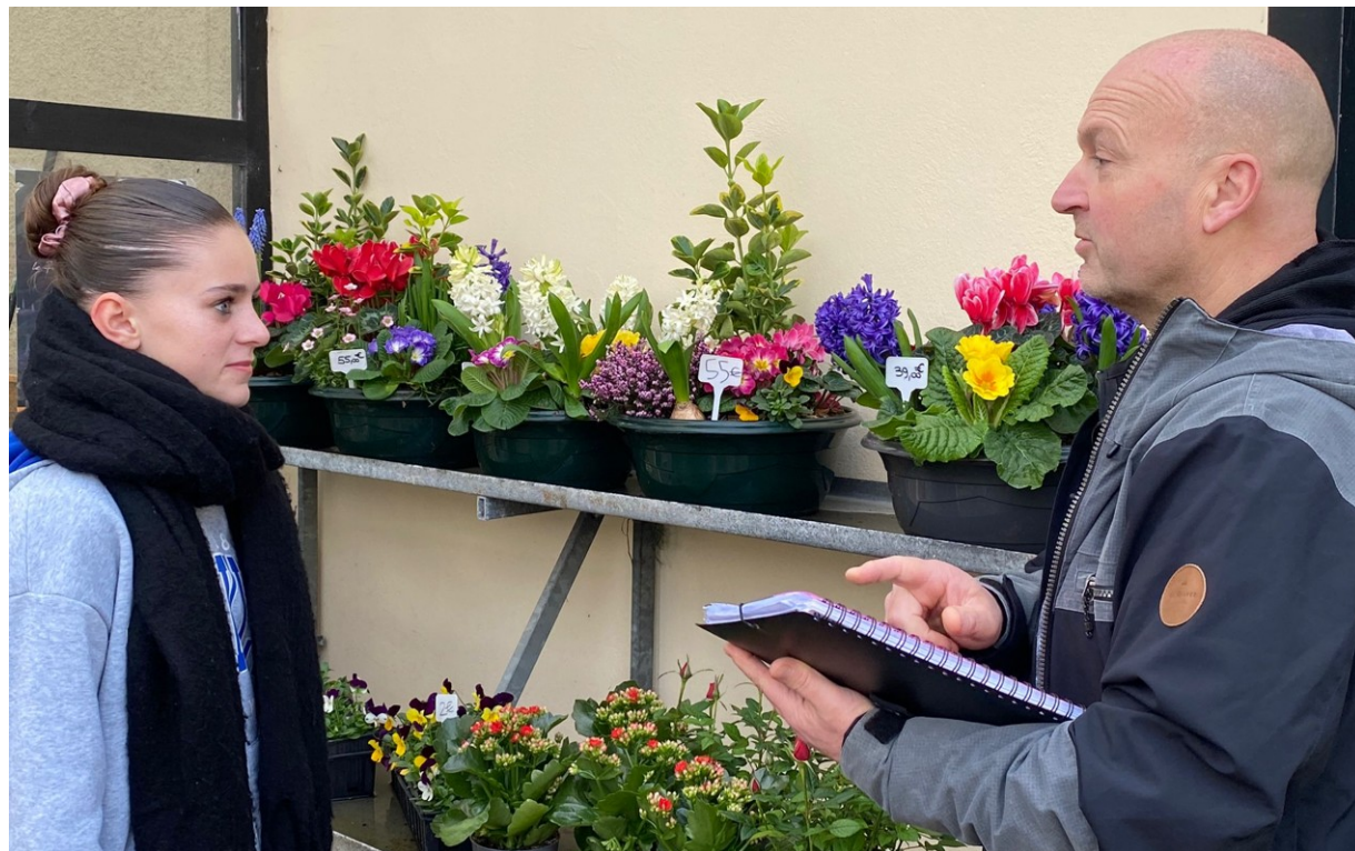
Le formateur suit le jeune en entreprise lors de visites de stage.

La formation en alternance peut s'effectuer sous statut scolaire, avec des périodes de formation en entreprise : le jeune reste un élève. Mais elle peut également s'effectuer sous